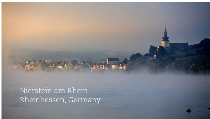
Nierstein am Rhein. Rheinhessen, Germany